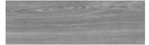
Cerezo Pearl / ADZ