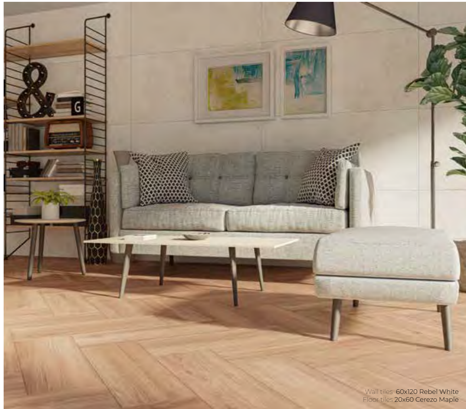
Wall tiles 60x120 Rebel White Floor tiles 20x60 Cerezo Maple