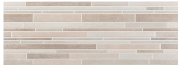
Rlv. Michigan Marfil