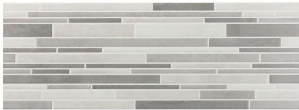
Rlv. Michigan Perla