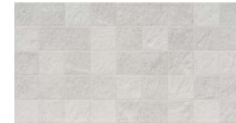
Rlv. Mystone Perla