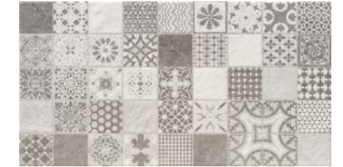
Hidra Mystone Perla