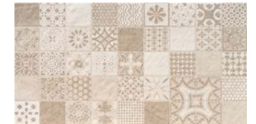
Hidra Mystone Marfil