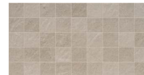
Rlv. Mystone Taupe