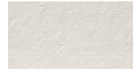
Rlv. Mystone Blanco