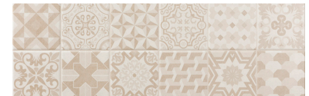
Dc. Travis Taupe