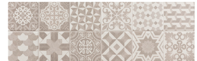
Dc. Travis Perla