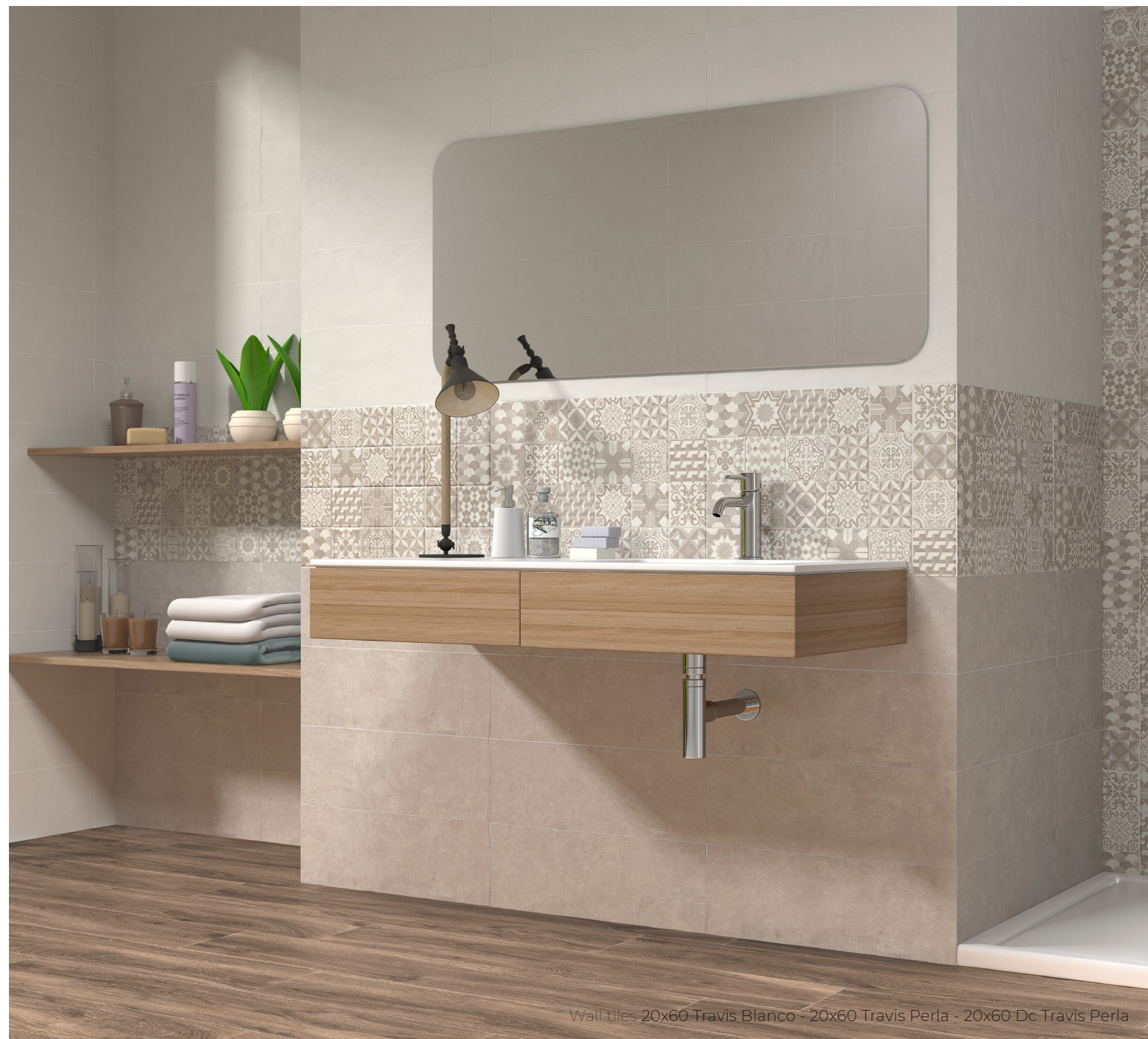
Wall tiles 20x60 Travis Blanco - 20x60 Travis Perla - 20x60 Dc Travis Perla